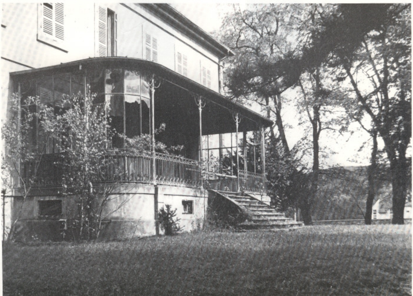
Vue arrière de la Villa Ferdinand Scheurer