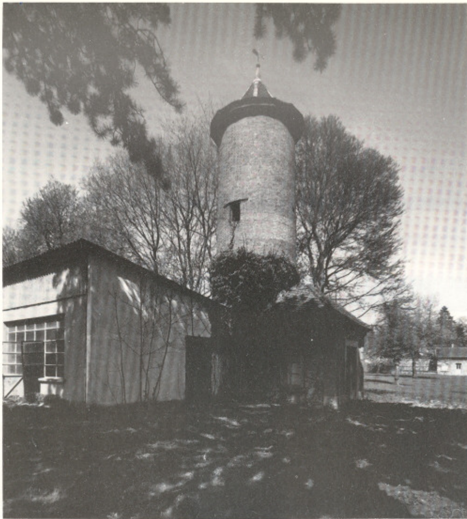
Le pigeonnier de la propriété Ferdinand Scheurer