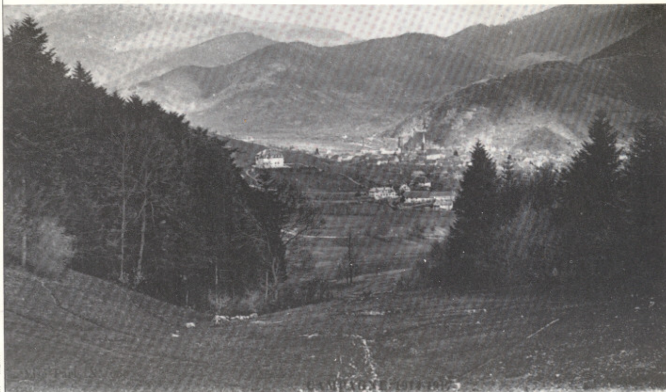
Vue générale de Bitschwiller en 1914