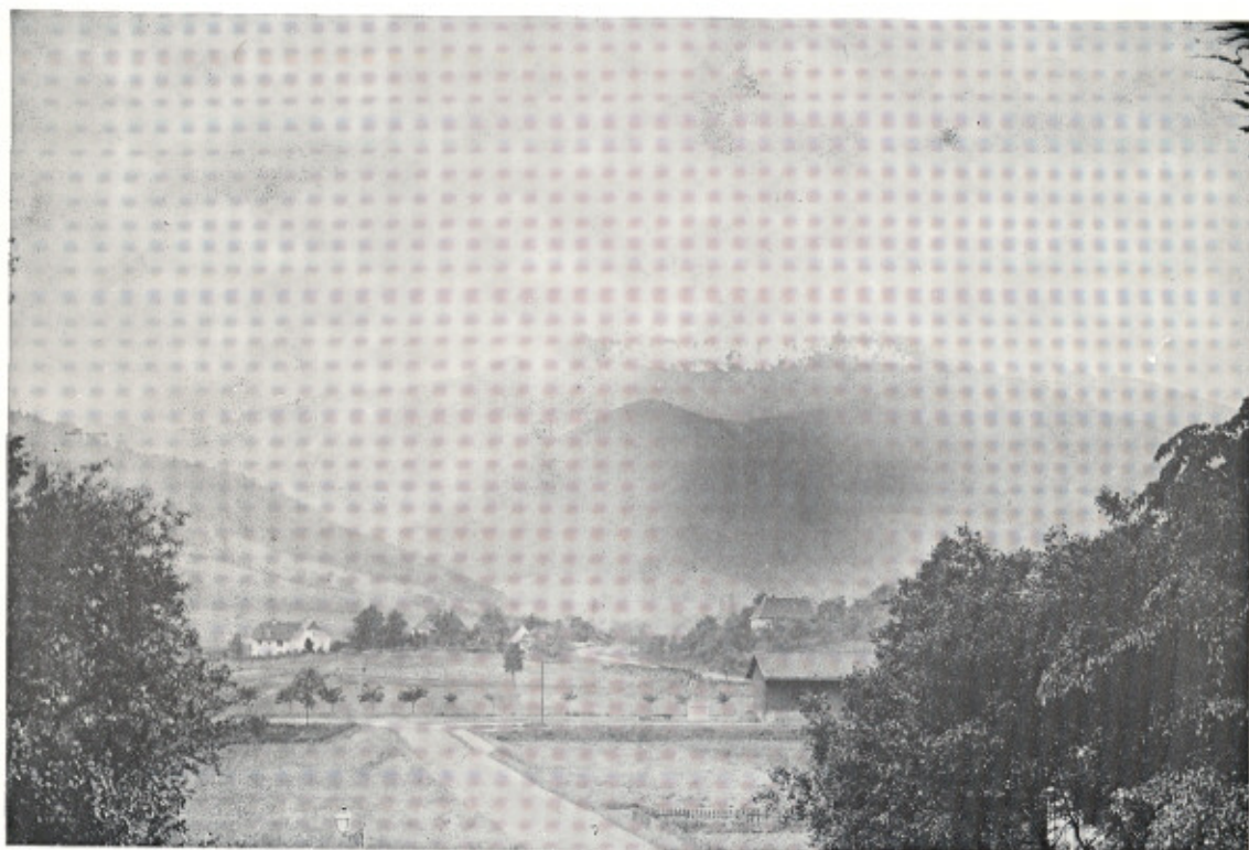
Bitschwiller, début du Siècle