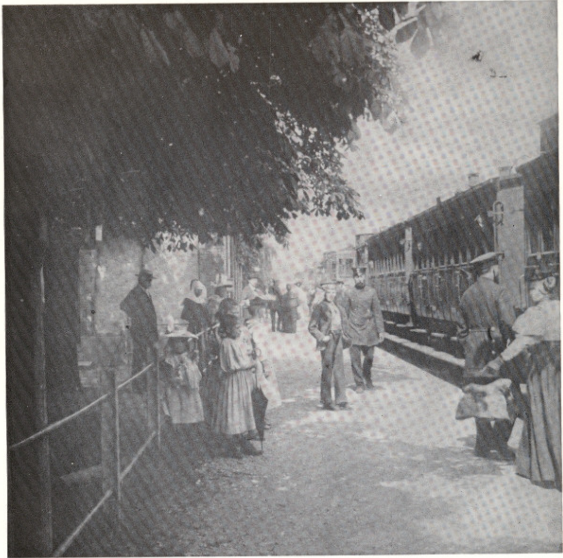
Gare de Bitschwiller-lès-Thann en 1897